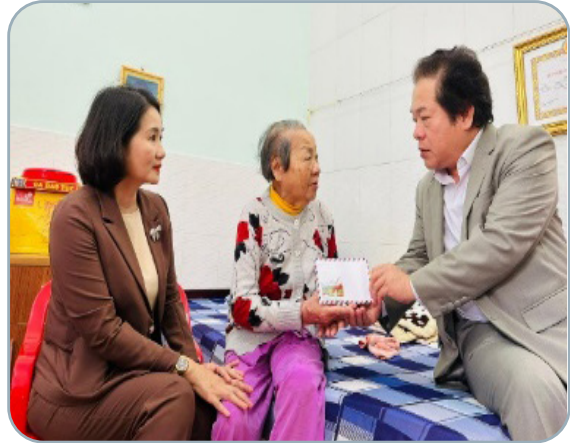
Hình 6.6. Lãnh đạo tỉnh thăm hỏi và trao quà Tết cho Người có công tại Trung tâm Điều dưỡng Người có công tỉnh

– Phong trào xây nhà ở cho người có công được đẩy mạnh nhằm tạo điều kiện cho các gia đình người có công với cách mạng có chỗ ở ổn định, yên tâm lao động sản xuất, phát triển kinh tế gia đình, giúp họ giảm bớt những khó khăn, góp phần thực hiện chính sách an sinh xã hội ở địa phương, đồng thời nâng cao nhận thức của toàn xã hội, tạo niềm tin sâu sắc vào hoạt động đền ơn đáp nghĩa. Bên cạnh đó, hàng năm, Sở Lao động – Thương binh và Xã hội tỉnh Quảng Ngãi đã tổ chức các đợt điều dưỡng cho người có công. Chỉ tính riêng năm 2023, ngành Lao động – Thương binh và Xã hội đã thực hiện điều dưỡng cho hơn 17,5 nghìn lượt người có công với tổng kinh phí gần 29 tỷ đồng; tiếp tục thẩm định hồ sơ, giải quyết cho 2 274 trường hợp hưởng chế độ trợ cấp chính sách người có công theo quy định. Qua đó, chăm sóc sức khỏe, an ủi tinh thần, kịp thời hỗ trợ, động viên họ vươn lên trong cuộc sống.