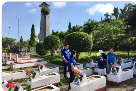
Hình 6.3. Đoàn viên, thanh niên trong tỉnh chăm sóc và viếng hương nghĩa trang liệt sỹ

– Quá trình xây dựng “Quỹ đền ơn đáp nghĩa” được các cấp chính quyền, các cơ quan, đoàn thể, các tổ chức, cá nhân trong tỉnh tích cực hưởng ứng. Từ năm 2012 đến năm 2023, các tổ chức, cá nhân đã đóng góp vào Quỹ “Đền ơn đáp nghĩa” của