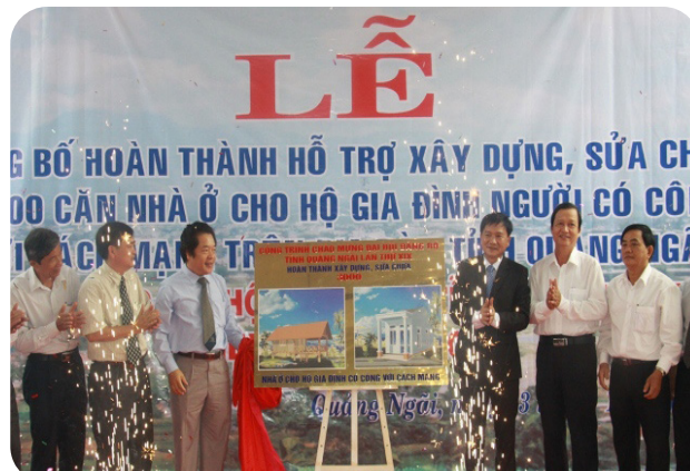
Hình 6.7. Lễ công bố hoàn thành hỗ trợ, sửa chữa nhà ở cho Người có công trên địa bàn tỉnh Quảng Ngãi

– Phong trào xây nhà ở cho người có công được đẩy mạnh nhằm tạo điều kiện cho các gia đình người có công với cách mạng có chỗ ở ổn định, yên tâm lao động sản xuất, phát triển kinh tế gia đình, giúp họ giảm bớt những khó khăn, góp phần thực hiện chính sách an sinh xã hội ở địa phương, đồng thời nâng cao nhận thức của toàn xã hội, tạo niềm tin sâu sắc vào hoạt động đền ơn đáp nghĩa. Bên cạnh đó, hàng năm, Sở Lao động – Thương binh và Xã hội tỉnh Quảng Ngãi đã tổ chức các đợt điều dưỡng cho người có công. Chỉ tính riêng năm 2023, ngành Lao động – Thương binh và Xã hội đã thực hiện điều dưỡng cho hơn 17,5 nghìn lượt người có công với tổng kinh phí gần 29 tỷ đồng; tiếp tục thẩm định hồ sơ, giải quyết cho 2 274 trường hợp hưởng chế độ trợ cấp chính sách người có công theo quy định. Qua đó, chăm sóc sức khỏe, an ủi tinh thần, kịp thời hỗ trợ, động viên họ vươn lên trong cuộc sống.