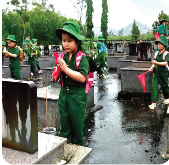
Hình 6.9. Học sinh trường Mầm non Tịnh Đông (huyện Sơn Tịnh) viếng hương tại Nghĩa trang Liệt sỹ Xã trong Hoạt động trải nghiệm “Một ngày làm chiến sỹ”

– Bên cạnh những hoạt động trên, tỉnh Quảng Ngãi cũng quan tâm chăm sóc thương binh, bệnh binh, chú trọng những trường hợp nặng, chăm sóc bố mẹ liệt sỹ già yếu neo đơn, con liệt sỹ mồ côi; tổ chức mô hình “Bữa sáng yêu thương”... với những hành động ấm áp, nghĩa tình. Đền ơn đáp nghĩa ở tỉnh Quảng Ngãi còn thể hiện qua chăm sóc ông bà, cha mẹ, những người hỗ trợ, giúp đỡ chúng ta trong cuộc sống thường ngày.