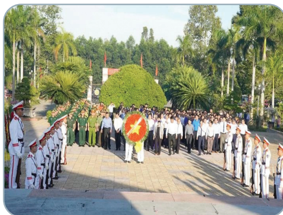
Hình 6.2. Lễ dâng hương tại Nghĩa trang Liệt sỹ tỉnh Quảng Ngãi