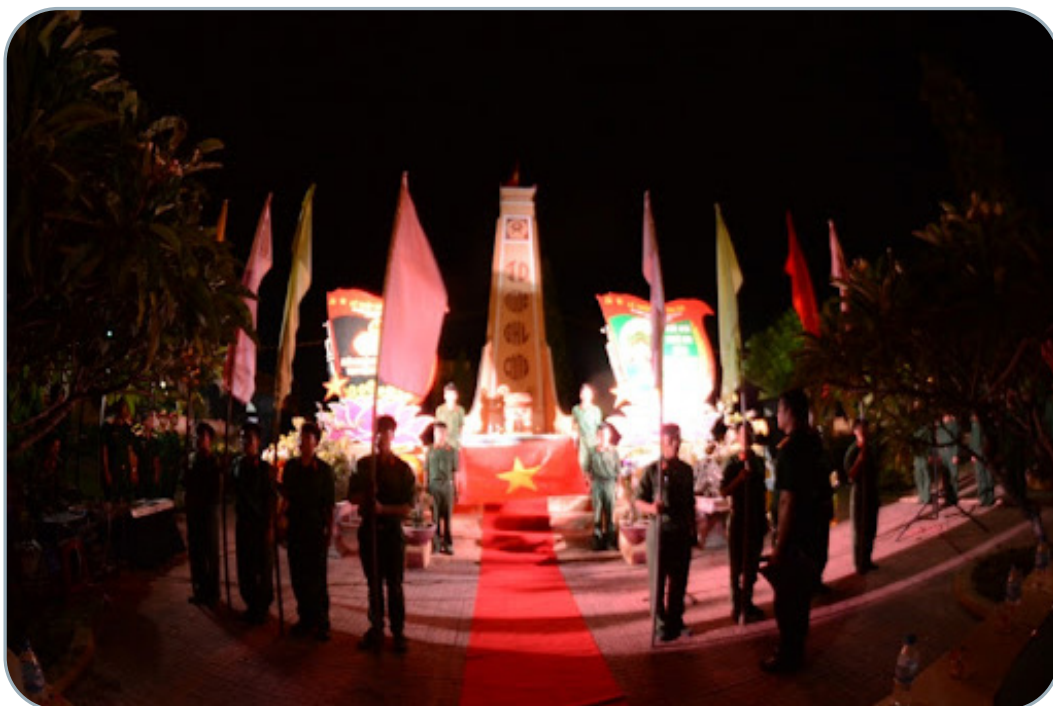
Hình 6.8. Lễ thắp nến tri ân tại Nghĩa trang Liệt sỹ phường Quảng Phú (thành phố Quảng Ngãi)

– Cũng trong những ngày này, tỉnh Quảng Ngãi đã tổ chức thăm hỏi, tặng quà, động viên thương binh, bệnh binh, người có công với cách mạng và thân nhân gia đình liệt sỹ đã cống hiến, hy sinh vì nền độc lập, tự do của dân tộc. Đây cũng là hoạt động có ý nghĩa nhân văn, thể hiện sự quan tâm, thấu hiểu sâu sắc của Đảng bộ tỉnh và chính quyền các cấp trong công tác đền ơn đáp nghĩa.