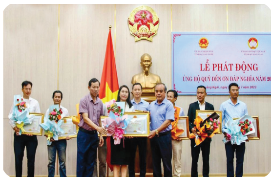
Hình 6.4. Tặng Bằng khen cho tập thể, cá nhân có thành tích đóng góp, ủng hộ Quỹ đền ơn đáp nghĩa năm 2023

– Quá trình xây dựng “Quỹ đền ơn đáp nghĩa” được các cấp chính quyền, các cơ quan, đoàn thể, các tổ chức, cá nhân trong tỉnh tích cực hưởng ứng. Từ năm 2012 đến năm 2023, các tổ chức, cá nhân đã đóng góp vào Quỹ “Đền ơn đáp nghĩa” của