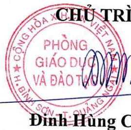
Đinh Hùng Cường