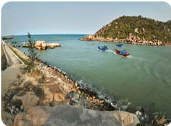
Hình 5.2. Cửa biển Mỹ Á (thị xã Đức Phổ)

Vùng biển Quảng Ngãi có nguồn lợi hải sản phong phú với nhiều loại cá, tôm, cua, mực, ... có giá trị kinh tế cao. Ngư trường đánh bắt rộng lớn, thuận lợi cho việc khai thác hải sản. Ngoài ra, vùng biển của tỉnh còn có các loại tảo, rong biển, ... có giá trị làm thực phẩm, dược phẩm. Dọc bờ biển và ven đảo có các bãi triều, vũng, vịnh, cửa sông tạo điều kiện để phát triển nuôi trồng thủy hải sản nước mặn, nước lợ.