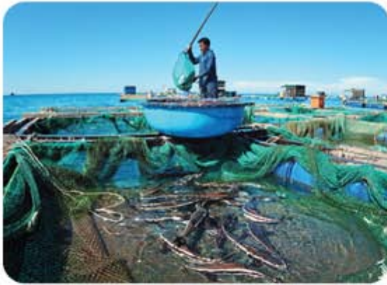
Hình 5.4. Nuôi hải sản ở huyện Lý Sơn