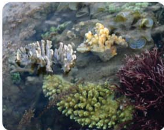
Hình 5.8. Đảo Lý Sơn nhìn từ trên cao Hình 5.9. San hô ở đảo Bé (huyện Lý Sơn)

Các khu du lịch biển đã được hình thành và đưa vào khai thác như: khu du lịch biển Khe Hai (huyện Bình Sơn), Mỹ Khê (thành phố Quảng Ngãi), Sa Huỳnh (thị xã Đức Phổ),... là động lực cho phát triển du lịch của tỉnh.