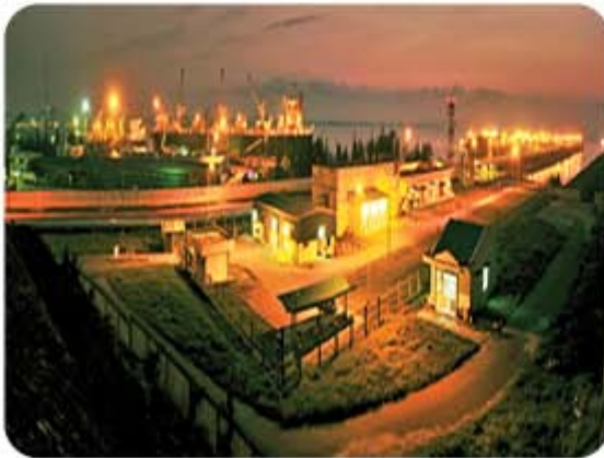
Hình 5.6. Cảng Dung Quất (huyện Bình Sơn)

Quảng Ngãi có hai cảng biển quan trọng là Dung Quất và Sa Kỳ. Cảng Dung Quất với lợi thế kín gió, độ sâu từ 10 – 19 m, gần các tuyến hàng hải nội địa và quốc tế, được thiết kế với hệ thống cảng đa chức năng, đảm bảo khối lượng hàng hoá thông quan khoảng 34 triệu tấn/năm (2020). Cảng Sa Kỳ nối đất liền với huyện Lý Sơn có chiều dài cầu cảng 106 m; diện tích cầu và sân bãi gần 7 500 m 2 . Cảng Sa Kỳ khai thác các dịch vụ cảng biển, vận chuyển hàng hoá và hành khách trên tuyến Sa Kỳ – Lý Sơn; đáp ứng kịp thời nhu cầu hàng hoá, hành khách qua lại đảo Lý Sơn, góp phần phát triển kinh tế – xã hội, đảm bảo quốc phòng – an ninh và bảo vệ chủ quyền biển, đảo của Tổ quốc. Ngoài ra, Quảng Ngãi còn có các cửa biển: Sa Cần, Sa Kỳ, Cổ Luỹ, Cửa Lở, Mỹ Á, Sa Huỳnh góp phần quan trọng trong giao thông đường thuỷ, thúc đẩy phát triển kinh tế – xã hội của tỉnh.