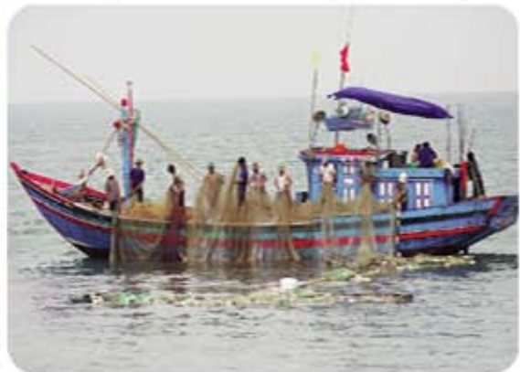
Hình 5.3. Khai thác hải sản trên biển

Với tiềm năng đa dạng, phong phú, ngành khai thác, nuôi trồng thủy hải sản của Quảng Ngãi nhất định sẽ phát triển để cung cấp nhu cầu thực phẩm cho nhân dân và tạo ra sản phẩm hàng hoá có chất lượng cao để xuất khẩu.