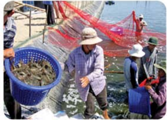
Hình 5.5. Nuôi tôm ở huyện Bình Sơn