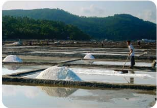
Hình 5.10. Sản xuất muối ở Sa Huỳnh

Những bãi cát ven biển có trữ lượng quặng titan sa khoáng khá lớn, tập trung chủ yếu ở huyện Bình Sơn và huyện Mộ Đức.