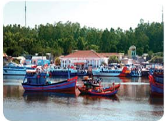
Hình 5.7. Cảng Sa Kỳ (huyện Bình Sơn)